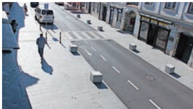
... in po njej