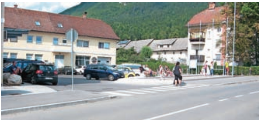
Prenovljen Kriški trg, ki je dobil varnejši izvoz.