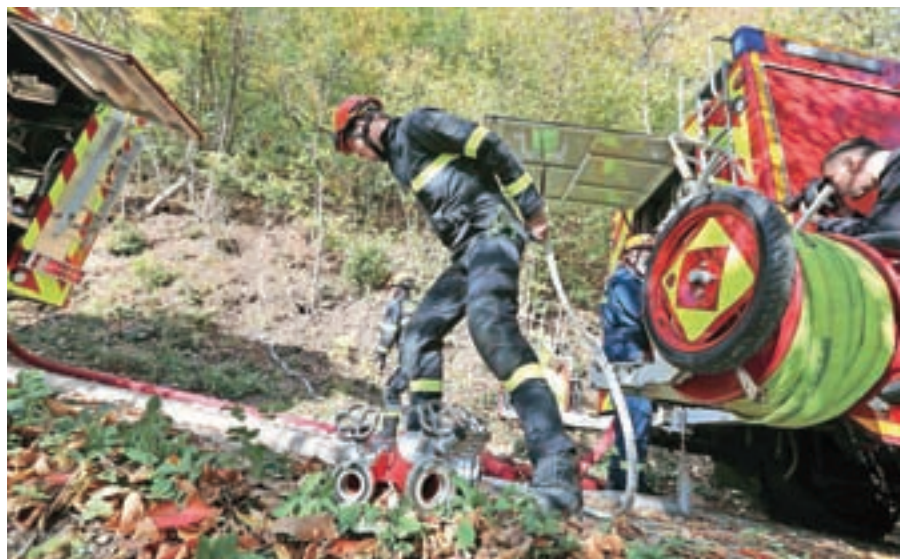
Oktober je bil mesec požarne varnosti. Na pobočju Šmarjetne gore nad Kranjem je bila velika gasilska vaja.