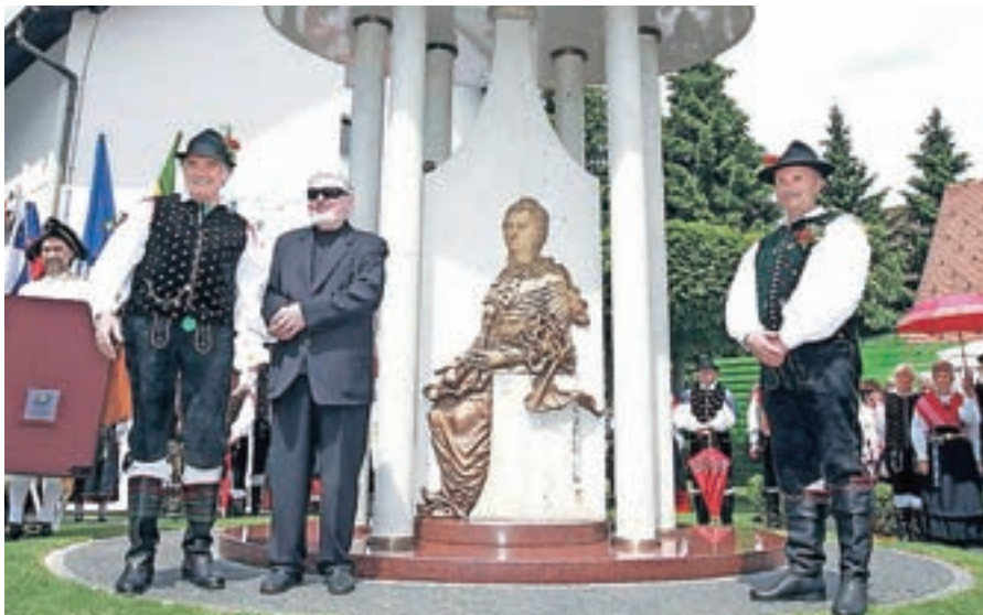
Marija Terezija je našim prednikom ukazala saditi krompir. Na to spominja spomenik sredi Šenčurja, ki so ga odkrili leta 2008.

podložnikov. Pred 250 leti je na Kranjskem ukazala saditi krompir, da ljudje ne bi bili lačni. Vladarica ima veliko spomenikov. Eden od njih, ki slavi tudi uvedbo sajenja krompirja, je tudi v Šenčurju. Upravna enota Radovljica je ljubljanski nadškofiji vrnila še dobrih osemsto hektarov gozda na Pokljuki, ki ima tako v lasti večino poključskih gozdov. V postopku je bilo še nekaj gozdov na območju Mrzlega studenca. Občina Preddvor je dobila v last planinsko kočjo na Jakobu nad Preddvorom. Upravljalo jo bo Planinsko društvo Preddvor. V Mengšu so praznovali občinski praznik.