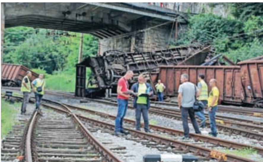
Iztirjeni vagoni na kranjski železniški postaji

gasilci in reševalci, ki so med najbolj obremenjenimi v državi (lani so imeli 1037 posredovanj), so dobili pol milijona evrov vredno novo vozilo. Prejšnje, staro 14 let, so podarili gasilcem v Gornji Radgoni. Družba Pokljuka, ki je povezana z ljubljansko nadškofijo, je po hotelu Bellevue v Bohinju kupila še hotel Pod Voglom. Turistično društvo Dovje - Mojstrana, staro 110 let, je uredilo na zemljišču domače agrarne skupnosti novo informacijsko točko ob Savi ob vstopu v vas. V Domžalah so temeljito preuredili stadion ob Kamniški Bistrici.