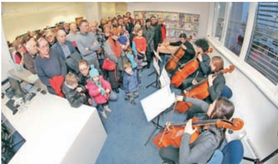
Nova knjižnica v Šenčurju