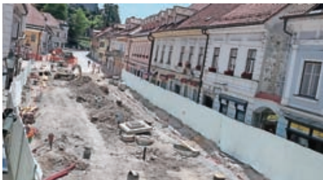
Glavni trg med obnovo ...

Člani KGT Papež so na Veliki planini gostili 16. evropsko prvenstvo v gorskih tekih. Kegljači KK Calcit Kamnik so postali državni prvaki, odbojkarji pa pokalni prvaki in državni podprvaki.