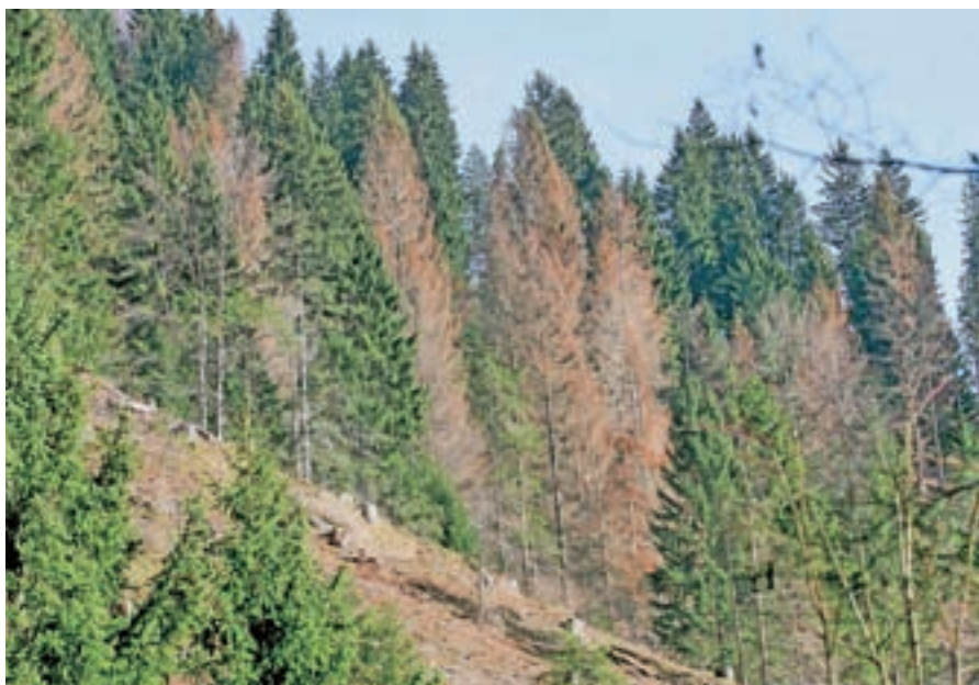
Zaradi lubadarja poškodovani gozd

Po 52 letih postavitve so podrli sedežnico na Zelenico, legendarno žičnico, ki je bila v dobrega pol stoletja priča vzponu tržiškega in tudi slovenskega smučanja, ki je v 47 letih delovanja (zadnja leta je mirovala, op. a.) popeljala v osrčje Karavank na tisoče planincev in je bila priča tudi tragičnim dogodkom, ko so zahrbtni zeleniški plazovi jemali ljudem življenja. Zeleni-