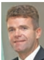
Župan Milan Čadež