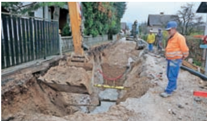
Gradnja kanalizacije v naselju Breg