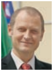
Župan Leopold Pogačar