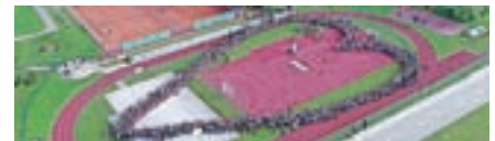
S tržiško verigo srca se je začel projekt Tržič – mesto dobrih misli in želja.