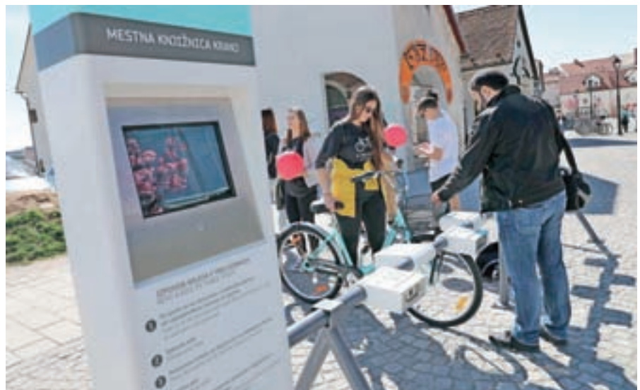
Sistem KRskOLESOM je bil med domačini in obiskovalci dobro sprejet, zato se bo v prihodnje še razširil.

Poleg skrbi za okolje je pomembna tudi prometna varnost, zato sta bila letos zgrajena nova cestna prehoda pri Trgovskem centru Tuš in pri kranjski vojašnici, nato pa še novo krožišče pri sodišču. Tal-