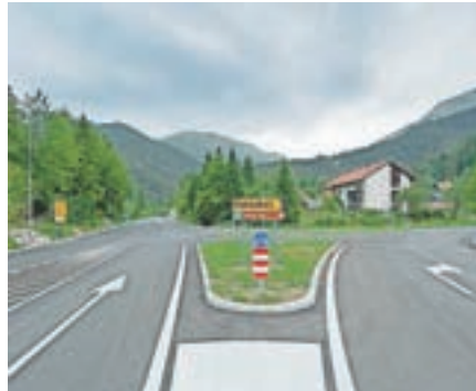
V Podljubelju je sodobno in varno križišče.

Križe, ki povezujejo štiri krajevne skupnosti, so bile tudi letos veliko gradbišče. Uredili smo Kriški trg, ki se s povezavo z obnovljeno cesto, avtobusnima postajališčema, pločniki, prehodi za pešce in javno razsvetlavo nadaljuje v smeri šole in modernejšega centra vasi. Projekt je posodobil asfaltni dostop do teniških igrišč in naprej proti Pristavi, meteorno odvodnjavanje ter novo makadamsko parkirišče za velike potrebe vasi in nastajajočega razširjenega športnega parka Križe. Veseli smo podatka, da je Tržič vse bolj zanimiv za turiste. Bogati se tudi ponudba zanje. S petimi novimi namestitveni-