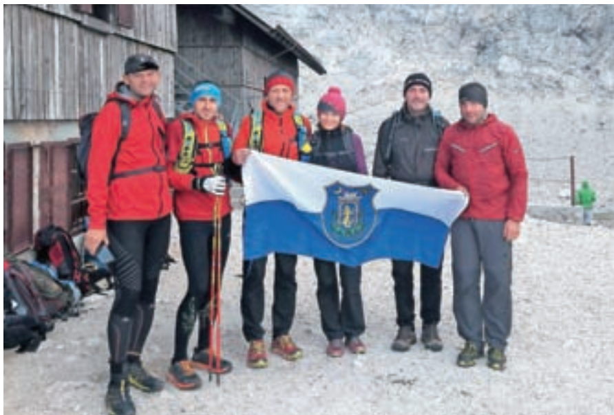
Ekipa planincev, ki je v pičlih 24 urah prehodila pot od Kamniške Bistrice do Triglava.