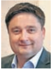
Župan Boštjan Trilar