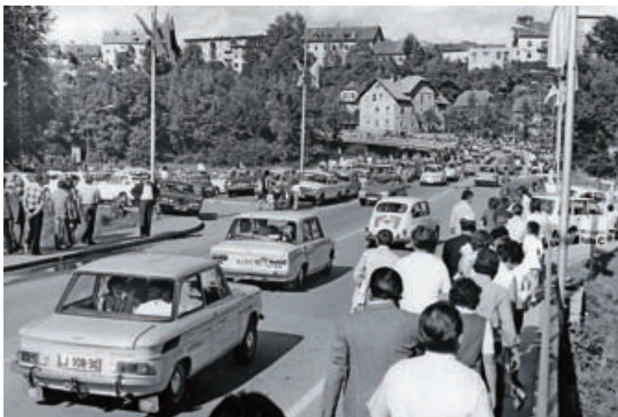
Gorenjski glas je beležil čas tudi v sliki: množični obisk Gorenjskega sejma v Kranju.