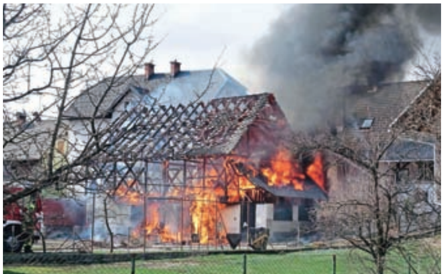
Na Bledu je ogenj uničil gospodarsko poslopje in stanovanje.