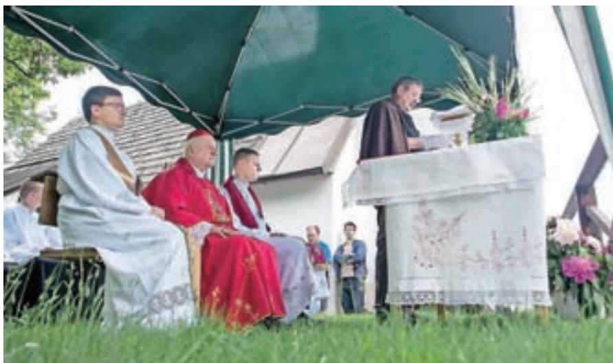
Pred občinskim praznikom so na Sv. Jakobu pripravili slovesnost ob prevzemu planinske koče in mašo, kjer je somaševal kardinal Franc Rode.

Letos začenjajo gradnjo vodovoda Bašelj-Mače, prva faza bo potekala v Bašlju.