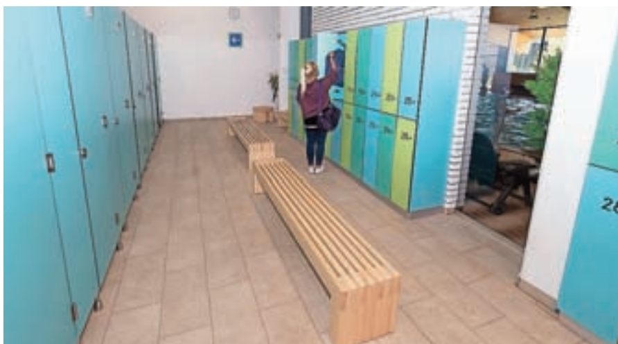
Prenovili so garderobe in vhodno avlo ob plavalnem bazenu.