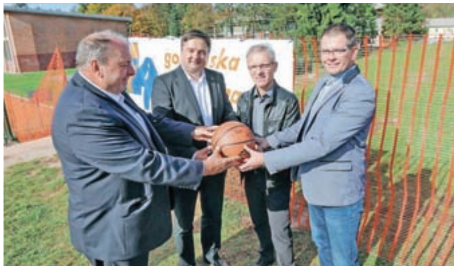
Svečan začetek gradnje nove telovadnice v Stražišču