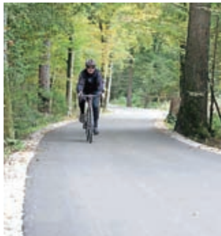
Kolesarska povezava med Šenčurjem in Kranjem

izvajati konkretne ukrepe, ki bodo občanom in obiskovalcem omogočili izbiro trajnostnih potovalnih načinov. Razvojna strategija pa se poleg prometnega dotika tudi drugih področij življenja občanov, od gospodarstva do kulturnega, športnega in družabnega življenja prebivalcev. Za kakovost njihovega življenja pa že zdaj skušajo storiti čim več. Tako so denimo spomladi preselili krajevno knjižnico, ki ima v najetih prostorih na Delavski cesti več prostora in v pritličju tudi lažji dostop.