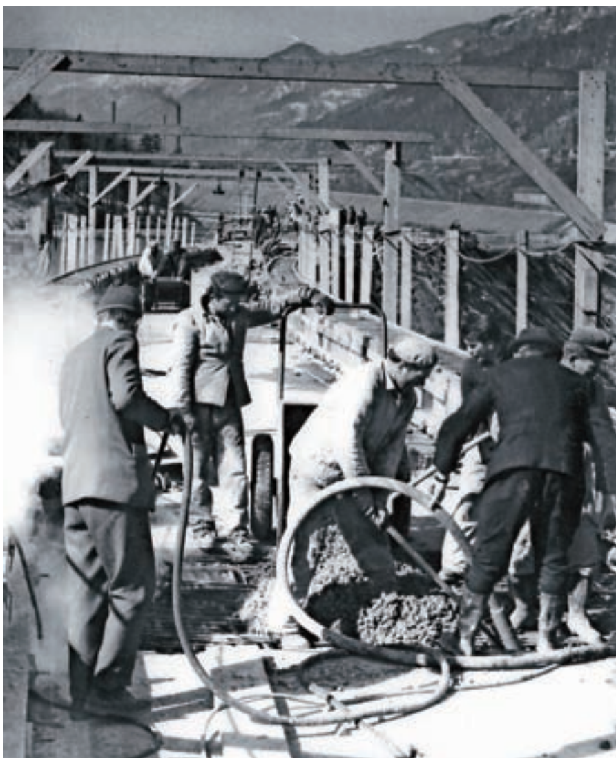
Gradnja nove valjarne na Koroški Beli, Jesenice, 2. 10. 1969

»Na pokušino vam tokrat ponujamo novo prilogo Gorenjskega glasa Odrpte strani, ki bo prihodnje leto izhajala enkrat na mesec na štirih straneh. Zamislili smo si jo tako, da bi v njej objavljali poglobljene, polemične, kritične in