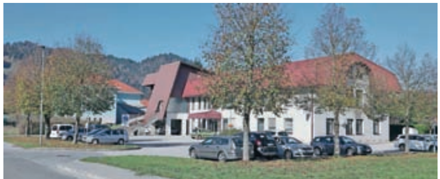
V bližini zdravstvenega doma bo podjetje Orphea, d. o. o., zgradilo Dom Žiri – središče za kakovostno sožitje.

V Osnovni šoli Žiri in njeni okolici so v maju pripravili prvi ŽirFit, na katerem so občani s pomočjo strokovnjakov s področja zdravstva in športa lahko preverili svoje telesne zmogljivosti. Testiranje je vključevalo test hoje na dva kilometra, preverjanje telesne zmogljivosti in po želji še tek na šeststo metrov. Testiranje je bilo namenjeno starejšim od dvajset let, udeležilo pa se ga je več kot tristo Žirovcev.