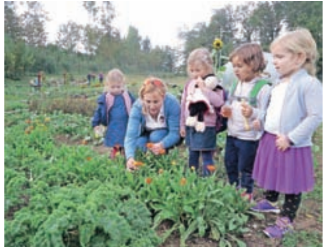
V letošnji izjemni turistični sezoni v občini Radovljica beležijo četrto milijona nočitev. Šolski učni vrt deluje v sklopu projekta Narava nas uči.

Rekonstrukcija je bila zaključena tik pred koncem počitnic, tako da se je letošnje šolsko leto začelo z bistveno izboljšano varnostjo na šolskih poteh. Občina je namreč s prvim septembrom na Letališki ulici v Lescah z novim pločnikom dopolnila varno šolsko pot, na odseku Begunjske ceste mimo šole pa je po novem prepovedan promet za tovorna vozila. Na poti iz Kamne Gorice do OŠ Staneta Žagarja Lipnica je umeščen nov prehod za pešce na priključku za Zgoranje Dobravo, kjer je v bližini postavljeno tudi pokrito avtobusno postajališče. Drugo takšno novo avtobusno postajališče pa je urejeno na Dobrem Polju.