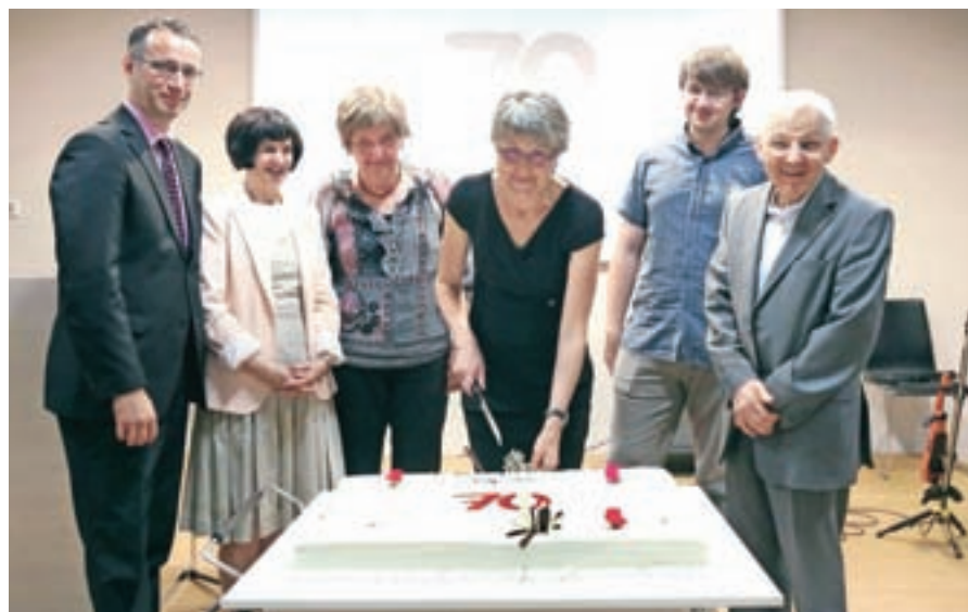
Sodelavci kranjske knjižnice in minister za kulturo Tone Peršak ob jubilejni torti.