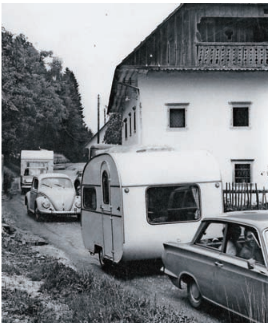
Gost promet v turistični sezoni po stari gorenjski cesti – skozi vas Podbrezje, julija 1966

škrate in delil darove. Dedek Mraz je delil darove vsem enako, dočim je škrate delil tistim, ki so mu razvozlati razne postavljene uganke. Najboljši pionirji pa so razen tega dobili kot nagrado še vsak po eno lepo knjigo. V Trziču so tovarne stopile v medsebojni stik ter porazdelile stvari tako, da so otroci po vseh tovarnah dobili enaka darila. Razen vseh otrok so bili povabljeni tudi starši in so malčke razen daril še pogostili. Tako so mladi kot stari občutili, da je to res nov otroški praznik. V Škofji Loki je prireditev Novoletne jelke prav tako dobro uspela. Partizani so pripovedovali razne zgodbe in doživlja iz partizanskih let. Dedek Mraz je v spremstvu palčkov obšel 700 otrok in jih vse obdaroval. V Kranju je bila ta otročja prireditev organizirana na več mestih, ali nikjer ne tako, kot bi bilo potrebno. Če je bila v kakšni tovarni obdaritev večja, so bili obdarjeni samo otroci, katerih starši delajo v tisti tovarni. Centralna obdaritev pa je bila več ali manj borna, ker so otroke samo pogostili. V nedeljski prireditvi je ta stvar le bolj uspela. Napake, ki so se zgodile v Kranju, pa bodo za bodoče v svarilo vsem organizacijam, kako se k takšnim prireditvam ne pristopa.«