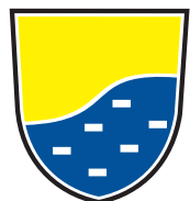
Občina Vodice Kopitarjev trg 1 Vodice