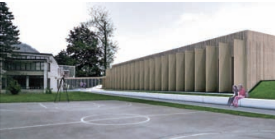
Oktobra se je začela gradnja nove telovadnice v Stražišću, ki naj bi bila dokončana jeseni prihodnje leto.

ne oznake za umirjanje prometa so bile postavljene v Mavčičah, varnejši dostop k šoli je bil urejen v Predosljah, nove so oznake za varnejšo pot kolesarjev in pešcev na Koroški cesti, urejena sta nova kolesarnica in prehod za pešce na Orehku.